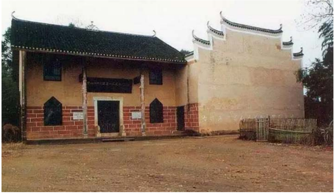
湖南衡山柴山洲特别区第一农民银行旧址——湖南省衡东县三樟乡金湖村夏拜公祠

衡山县是湖南省农民运动最先兴起的的地方。1923年9月，衡山白果镇成立了“岳北农工会”。1925年末，毛泽东派刚从广州农民运动讲习所学习毕业的共产党员、省农运特派员贺尔康到柴山洲指导农民运动。贺尔康到达衡山后，深入柴山洲秘密发展农会会员，培养发展了文海南、夏仁和、夏兆梅等农会积极分子为中共党员，先后建立农会小组，组织成立中共柴山洲支部。1926年4月，在筹备柴山洲特别区农民协会的同时，贺尔康按照中国共产党早期的农村金融政策主张，成立柴山洲特别区农民银行筹备处。