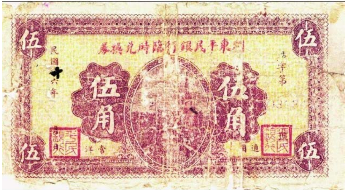
浏东平民银行临时兑换券

常洋五角临时兑换券长 15 厘米，宽 8 厘米，正面印有“浏东平民银行临时兑换券”和“伍角”等字样，还印有发行时间，编有号码，左右下方带有“平民银行”小印章，纸币背面印有“摘录浏东平民银行试办章程”，并盖有“浏东平民银行监事会之图记”的方印。常洋二角信用券正面左右两方还印有“打倒资本主义”“拥护农工政策”字样，体现了平民银行为工农服务的革命本色，正中下方印有“此券合成拾角即兑常洋壹元”。体现了以常洋为发行本位的兑换性。