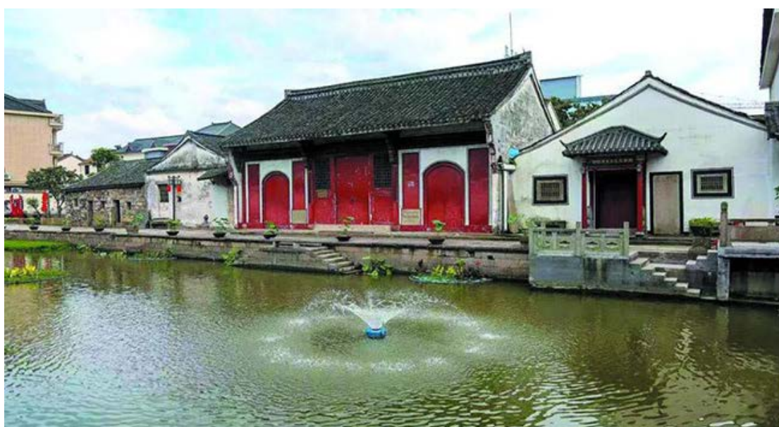
衙前农民协会和衙前信用合作社地点——东岳庙旧址

1923年1月26日，孙中山与苏联代表越飞公开发表《孙文越飞宣言》，孙中山得到了苏联军火和财政的大力援助。1924年1月，国民党第一次全国代表大会正式确立联俄、联共、扶助农工的新三民主义，国共两党开始了第一次合作。在此背景下，衙前农民协会重新恢复。鉴于1921年衙前农民运动失败的教训，迫切需要采取有效的斗争策略，建立属于农民阶级自己的经济支持机构和资金借贷机构，抵制地主豪绅的盘剥，衙前农民协会遂于1924年正式成立衙前信用合作社。信用社成立时，办公地点设在了衙前东岳庙内。当时农会利用东岳庙的西侧屋作为办公室，信用社就在农会的办公室内办公。