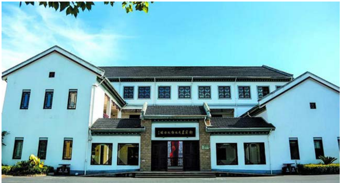
衙前农民运动纪念馆

二十世纪二十年代，位于浙江省萧山县的衙前村，地处萧绍平原，是浙东运河沿岸的一个农村集镇，距离杭州 60 余里，当时的萧山农民深受天灾人祸的折磨，